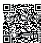
GRAS - Faktaark