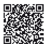
STSBA - Sikker bruk av arbeidsutstyr